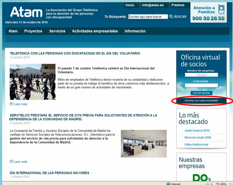
Imagen nº 1